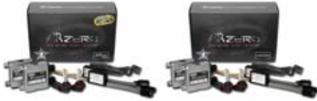
H4 HID HP6000K ●左ハンドル用 49,800円 ●右ハンドル用 49,800円 H4 HID 4500K ●左ハンドル用 44,800円 ●右ハンドル用 44,800円

●は JDS タイプ ●価格は、2014年12月20日までのスペシャルプライスです。