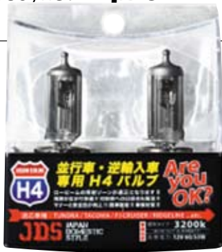
H4 ハロゲン 3200K ●左ハンドル用 9,800円